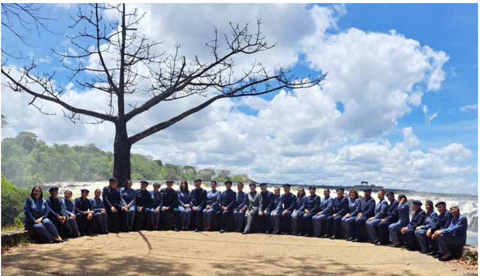
ORFEÓN UNIVERSITARIO DE LA UNIVERSIDAD CENTRAL DE VENEZUELA Venezuela, Caracas