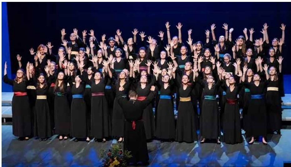
CORALA DE FETE „CIPRIAN PORUMBESCU“ Romania, Suceava