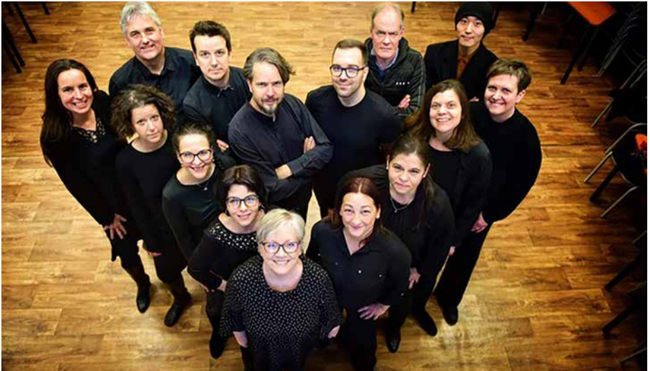
ARS NOVA VOCAL ENSEMBLE Ungheria / Hungary, Kecskemét