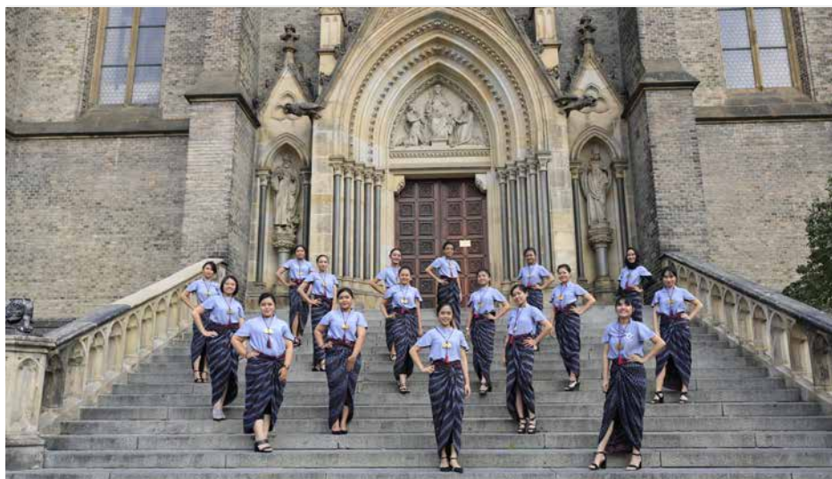
GRATIA FEMALE CHOIR OF SOEGIJAPRANATA CATHOLIC UNIVERSITY Indonesia, Semarang, Jawa Tengah