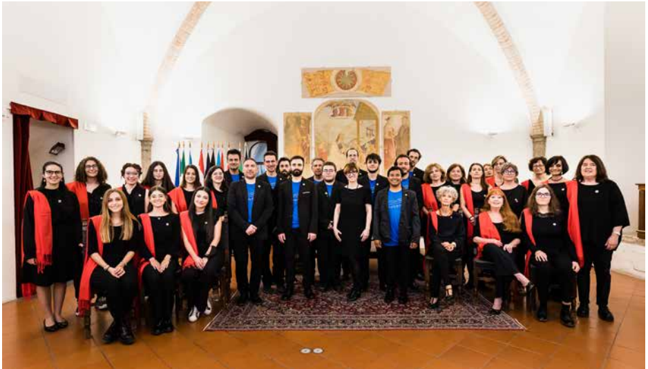
CORO DELL'UNIVERSITÀ DEGLI STUDI DI PERUGIA Italia / Italy, Perugia