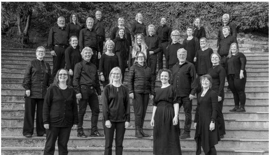
BERGEN KAMMERKOR Norvegia/ Norway, Bergen

Direttori / Conductors: Francesca Aquilina / Tom Armitage