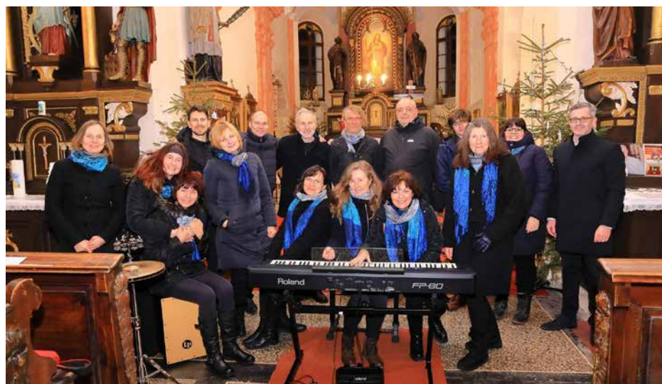
PĚVECKÝ SPOLEK KAPLICE Repubblica Ceca / Czech Republic , Omlenice