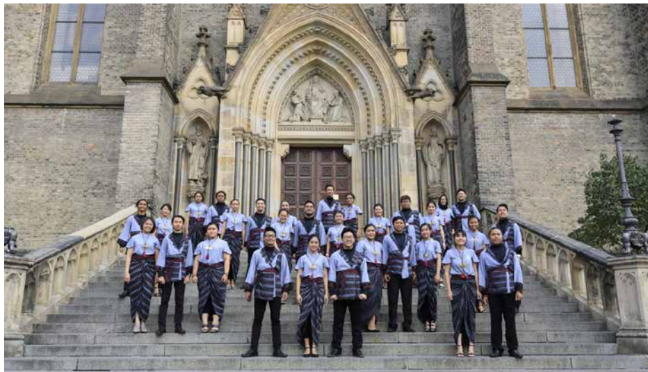
GRATIA CHOIR OF SOEGIJAPRANATA CATHOLIC UNIVERSITY Indonesia, Semarang, Jawa Tengah