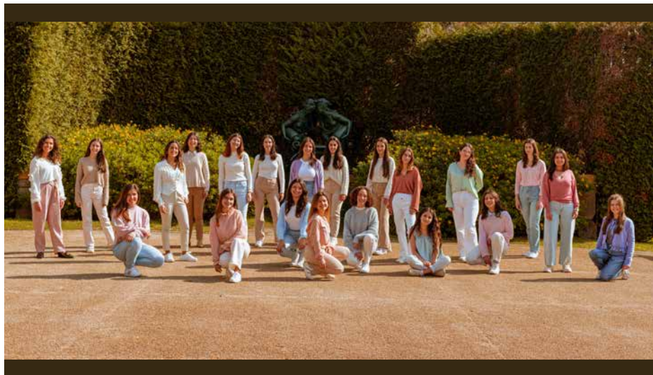
CORO FEMININO DO CONSERVATÓRIO DE MÚSICA DE PAREDES Portogallo / Portugal , Paredes