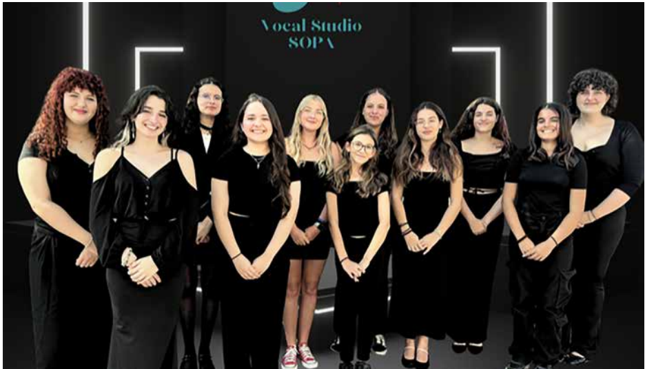
S.O.P.A. VOCAL STUDIO CHOIR Malta, Swatar