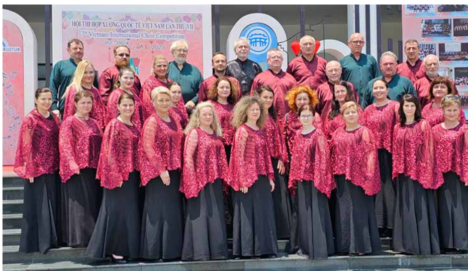
CANTICA COLLEGIUM MUSICUM Slovacchia / Slovakia, Martin